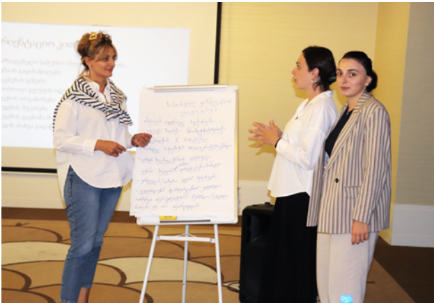
Wir boten unseren lokalen Partnern Schulungen an, wie sie die Bevölkerung und die Behörden in Projekte zur Verbesserung der Situation involvieren können.