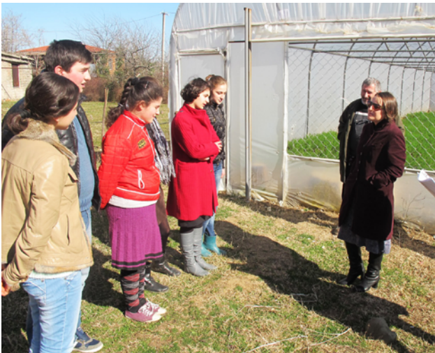
Jugendliche lernen, ein Gewächshaus zu betreiben. Wir haben eine Schule beim Bau eines Modell-Gewächshauses unterstützt, um Jugendlichen und Kleinbauern das nötige Wissen zu vermitteln.

Covid-19 brachte viele sehr arme Familien an den Abgrund, weil jegliche Einkommensquelle wegbrach. World Vision-Gruppen und lokale Partner setzten alles daran, gemeinsam mit den Behörden Hilfsmassnahmen für die am stärksten gefährdeten Kinder und ihre Familien zu planen und umzusetzen. Weil die Gruppen schon vor der Pandemie gut unterwegs waren und auf allen Ebenen ganz in die Prozesse eingebunden waren, schafften sie es auch trotz schlechter Internetverbindungen, Lebensmittelpakete für notleidende Familien zu organisieren – ohne Doppelspurigkeiten.